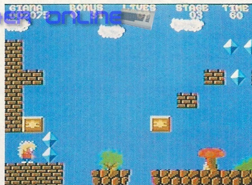
Viele Feinde und Finessen erwarten die kleine Giana auf 32 faszinierenden Levels

Traum, wenn sie den Riesendiamanten findet.