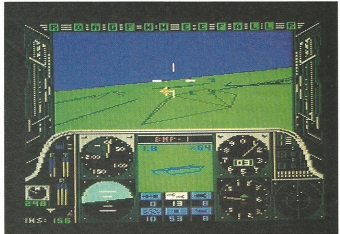
Der Zielcomputer von »Gunship« hat einen Gegner entdeckt

Hubschrauber sind recht kompliziert zu steuern. Das gilt auch für die beiden Simulatoren. Sowohl Joystick wie auch Tastatur werden benutzt. Zusätzlich werden