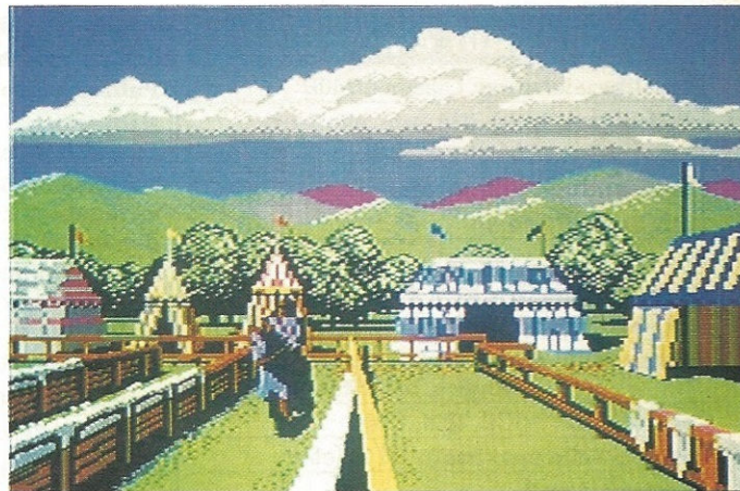
Auf geht's zum Turnier (Defender of the Crown)

Wir befinden uns im Mittelalter. In Großbritannien tobt ein Krieg: Nach dem Tode des Königs strei-