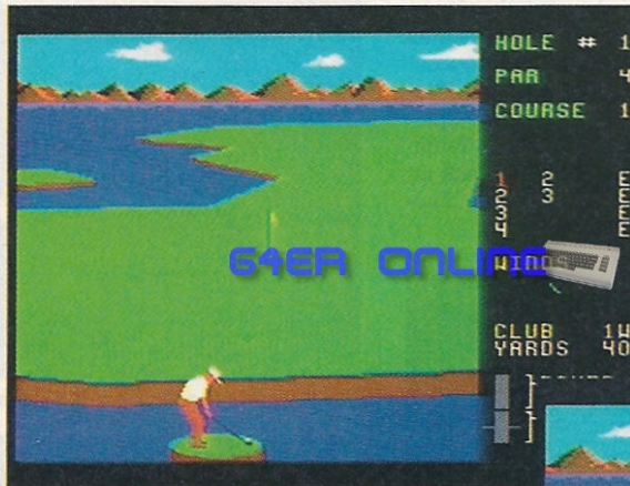
Welcher Schläger macht sich jetzt am besten?

Viele Sportarten gelten als Privileg der Reichen. Nach Tennis, findet das Golfspiel immer mehr Anhänger auch bei nicht so betuchten Zeitgenossen. Wer keinen Golfplatz vor der Haustür hat oder wem das Wetter einen Strich durch die Rechnung macht, kann jedoch ganz beruhigt auch auf den C64 zurückgreifen. Die Golfsimulation »Leader Board« bietet Spielspaß pur. Die Kurse werden als Vektorgrafiken auf dem Bildschirm aufgebaut, was hohe Flexibilität beim Bildschirmaufbau gewährleistet. Sie sind sehr detailliert gestaltet und man findet Wiesen, Sandflächen, Bäume, Flüsse und Teiche, kurz: alles was man sich von einem Golfplatz wünscht. Mit dem Joystick wird die Spielfigur gesteuert und mit dem Button der Schlag kontrolliert. Der Golfspieler ist sehr gut animiert. Er setzt noch heute Maßstäbe auf diesem Gebiet. Zunächst wählt man zwischen den verschiedenen Schläger-Typen, was natürlich einiger Erfahrung bedarf. Ein paar Schmökerstunden in Golf-Literatur bewir-