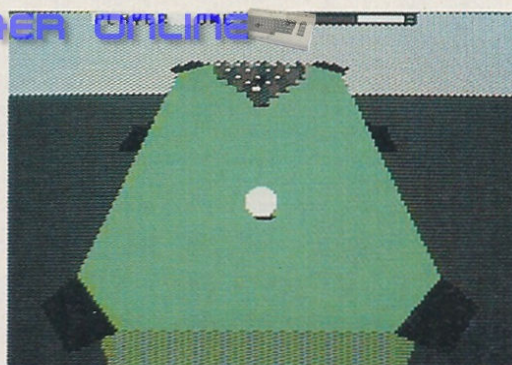
Noch stehen alle Kugeln in Reih' und Glied...

sterschaft, sondern einem neuen Spiel von Firebird für den C64: »3D Pool«.